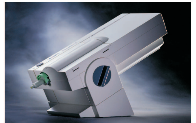
Abb.6: Pentamix 2

Mit dem PENTAMIX 2 steht ein Nachfolgemodell für den bewährten PENTAMIX zur Verfügung, der das einfache und bequeme Handling bei doppelter nutzbarer Verarbeitungszeit bietet, ohne Verlängerung der Gesamtverarbeitungszeit. Die gewohnt hohe Mischqualität der Abformmaterialien und somit die Erstellung von Modellen höchster Qualität bleiben erhalten.