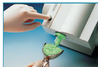
Abb.3: Befüllen des Löffels mit dem PENTAMIX 2.