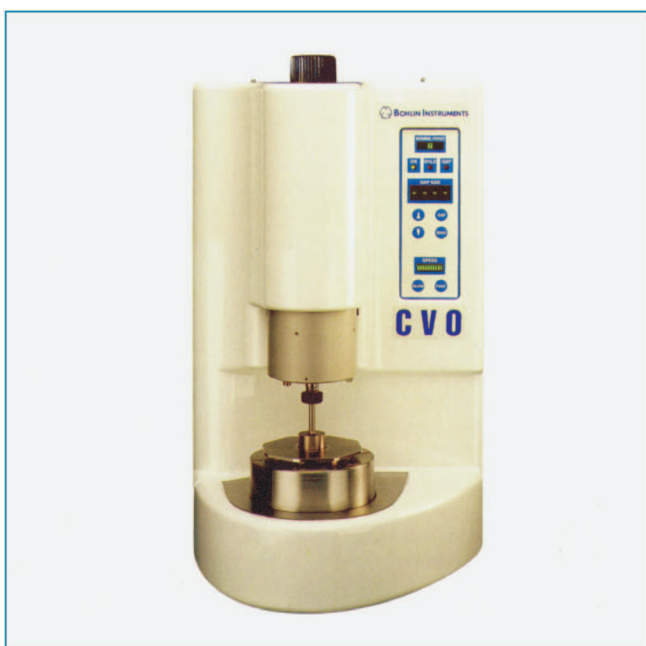
Abb.1: Bohlin-Rheometer System

Es wurden je 10 Löffel mit PENTAMIX und PENTAMIX 2 befüllt. Für die Auswertung der Daten wurde die T-Test-Statistik verwendet.