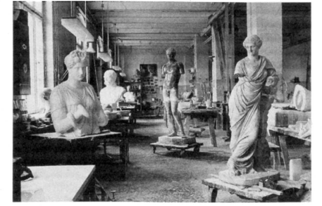
Werkstatt der Gipsformerei

Thomas Schelper Gipsformerei der Staatlichen Museen zu Berlin Preußischer Kulturbesitz Sophie-Charlotten-Straße 17/18 14059 Berlin Telefon 030 326 769- 00 Fax 030 326 769-12