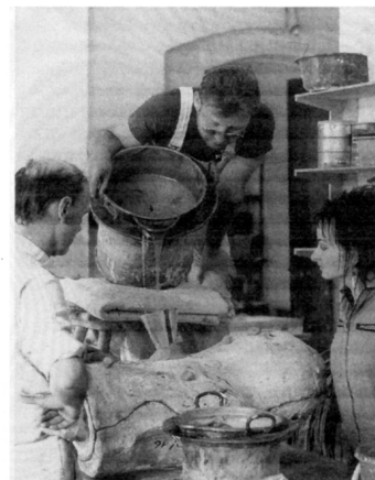
Eingießen der Gelantine