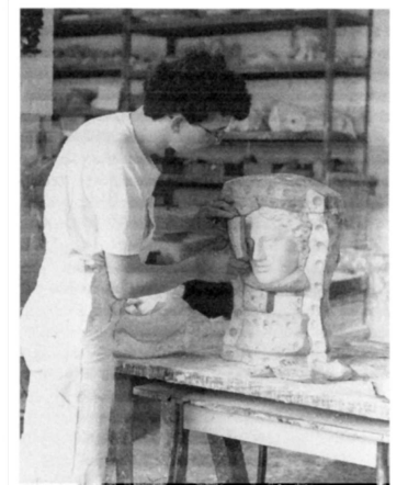
Abnahme eines Kernstücks