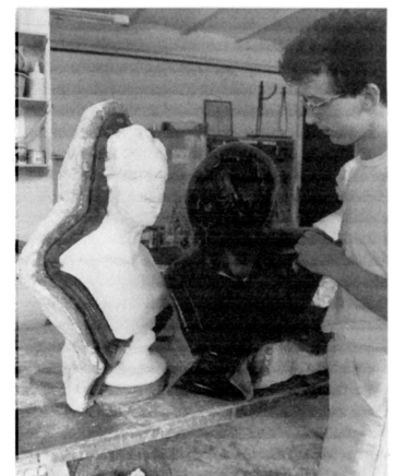
Abnehmen der Gelantineform