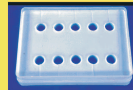
Abb.4 Silikonform zur Herstellung der Gipskörperpaare