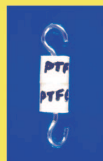
Abb.5 Gipskörperpaar mit Abzugshaken