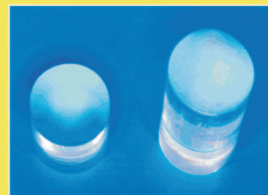
Abb.1 Plexiglaszylinder zur Herstellung der Silikonformen Zylinder links im Bild : h = 10\text{ mm} d = 10\text{ mm} Zylinder rechts im Bild : h = 20\text{ mm} d = 10\text{ mm}

Die Abzugskräfte der Referenzkörper wurden in dieser statistischen Auswertung nicht berücksichtigt, da es in 60% der Fälle zu einem Bruch der Prüfkörper außerhalb der Fügefläche kam (Abb.7).