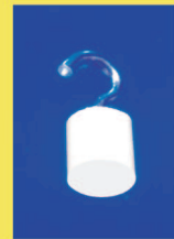
Abb.3 Gipsprüfkörper, dessen Stirnfläche mit Isoliermittel behandelt wurde