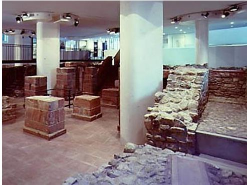
Abb. 1: Blick in die alte Ausstellung

Empore trifft man zunächst auf mehrere Kuppelvitruinen, in denen Ritualgegenstände, Gebetsbücher, aber auch die Chronik von Schudt 17 ausgestellt werden. Von dem erhöhten Standpunkt aus überblickt man den abgesenkten Raum mit den Ruinen (vgl. Abb. 2).