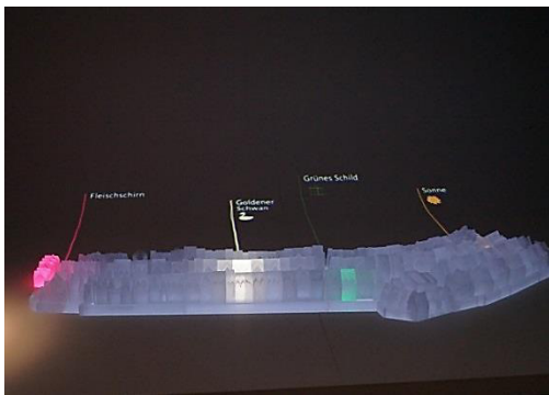
Abb. 4: Modell mit projizierten Hausnamen

Am Ende des Films geht die Art der Beleuchtung aber über diesen bescheidenen Anspruch hinaus: Zu der bedrohlichen Geräuschkulisse einer lodernden Feuersbrunst, flammt ein schnell um sich greifendes orangefarbenes und heftig flackerndes Licht in den Häusern auf und illustriert die filmischen Erläuterungen zu dem großen Brand 1711 sowie dem von 1796, der die langsame Auflösung und schließlich das Ende des Ghettos einleitete (Abb. 5). Die Beleuchtung, die das Feuer nachempfunden, setzt ein wahrhaft spektakuläres Fanal.