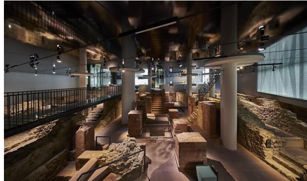
Abb. 2: Blick in die neue Ausstellung