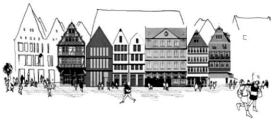
Abb. 6: Straßenansicht des DomRömer Quartiers

im Kindergarten, stellt sich ein beruhigendes Gefühl der Vertrautheit und sogar Sympathie ein. Das Bedrohliche des Unbekannten wird ‚gebannt‘, indem es einen Namen erhält. Noch mehr Sympathien werden dadurch geweckt, dass viele Frankfurter die Märchennamen der Frühen Neuzeit bereits von den Häusern aus dem DomRömer-Quartier kennen und als hochgeschätzten Frankfurter Lokalkolorit (s. Abb. 6) wahrnehmen dürften. Die kindlich inspirierte Vereinnahmung der Judengasse als völlig vertrautem und heimischem Ort negiert beunruhigende Aspekte kultureller Fremdheit. Was Ethnolog*innen als Gefahr der Nostrifizierung im Gegensatz zur Exotisierung von Kultur bekannt ist (Breidenstein et al. 2013, S. 19), geschieht eben auch im musealen Kontext.