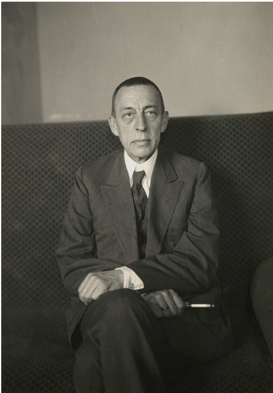
Porträt Sergej Rachmaninow. Dresden, um 1925. um 1925