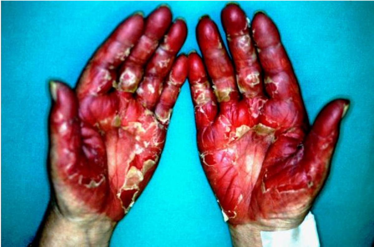
Palmar-plantare Erythrodysesthesie Grad IV an Händen und Füßen